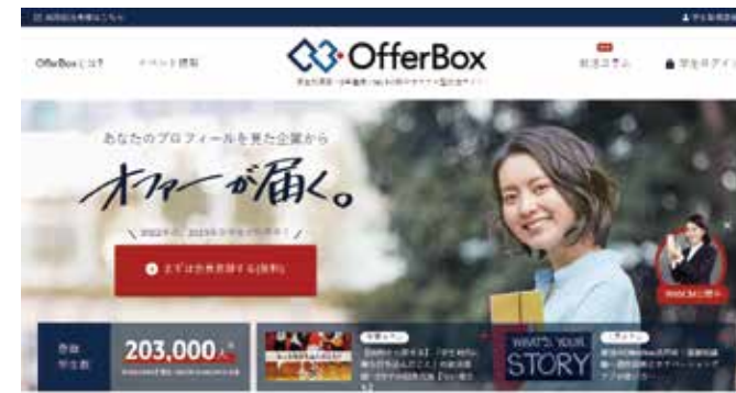
ダイレクトリクルーティング