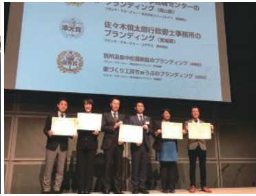
ブランディング事例コンテスト