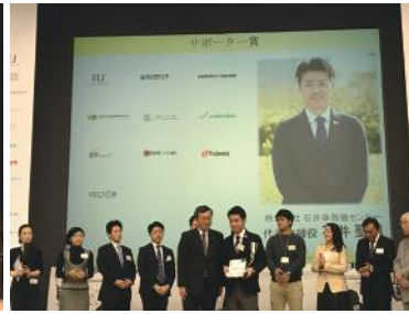
ビジネスプランコンテスト