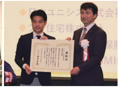
テレワーク総務大臣賞受賞