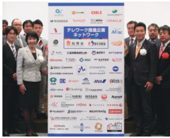
総務省 テレワーク先駆者百選受賞