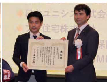
テレワーク総務大臣賞受賞