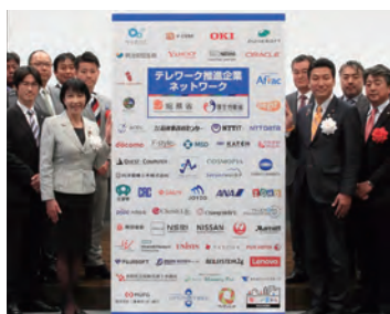
総務省 テレワーク先駆者百選受賞