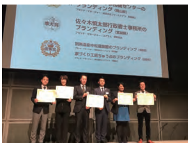
ブランディング事例コンテスト