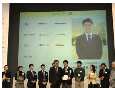
ビジネスプランコンテスト