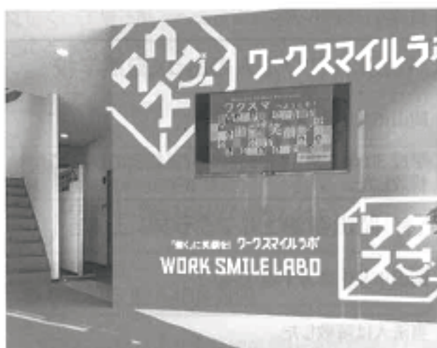
本社ではテレワークを使用した体験型の提案を行う