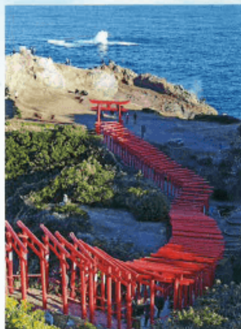
元乃隅神社