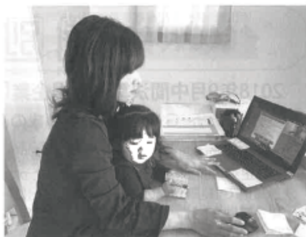
テレワークで多様なライフスタイルに合わせた多様な働き方が出来る

育児中の女性社員は子供の急な病気で休みを取ることが多く、そのことで同僚の業務の負担が増加する。その解決策として自宅で会社と同様の業務が可能となるテレワークを試行導入し、業務負担の軽減効果を検証した。その中で発生した労務管理、社員間のコミュニケーション、情報セキュリティの課題には自社で取り扱っていた商品やサービスを使って解決を図るなどでノウハウを蓄積。その後、テレワークの本格導入を経て、2016年に中小企業向けのテレワーク支援システムの取り扱いを開始した。自社のオフィスでテレワーク導入時の勤怠管理